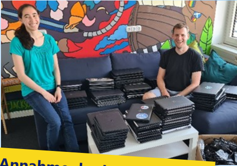
Annahme der Laptopspende