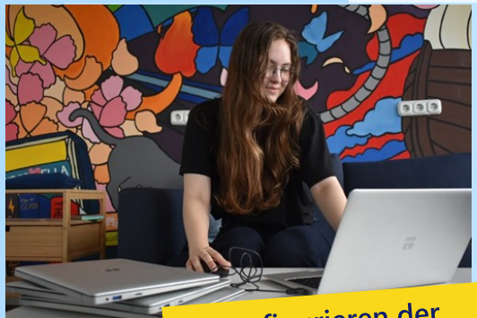
Konfigurieren der gespendeten Laptops