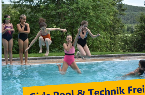
Girls Pool & Technik Freizeit Auf der Burg Wernfels