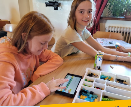
Camp „Lego spike“