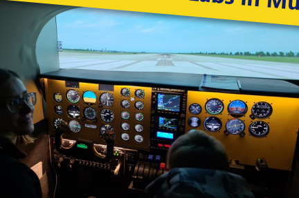
Besuch des MakerLabs in Murnau