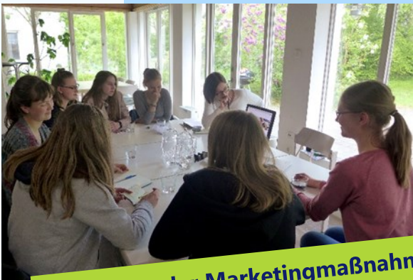
Erarbeiten der Marketingmaßnahmen durch die Jugendmitglieder