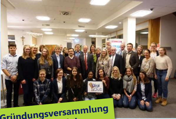
Gründungsversammlung des DigiClubs