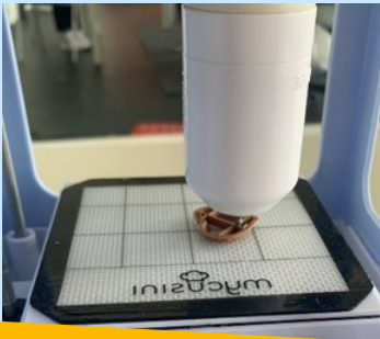
Schoko-3D Drucker Camp