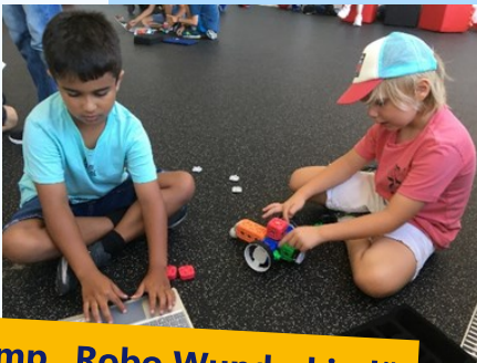
Camp „Robo Wunderkind“