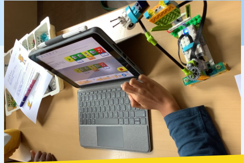
Lego Education an einer Grundschule